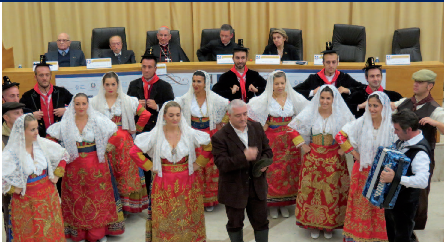
Esibizione del gruppo folkloristico della Fitp