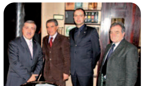
Un momento della firma del Protocollo