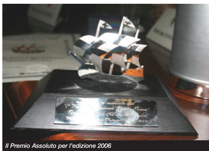
Il Premio Assoluto per l'edizione 2006

Presidenza del Consiglio dei Ministri, Ministero degli Affari Esteri, Ministero dell'Istruzione, dell'Università e della Ricerca, Ministero per i Beni e le Attività Culturali, Ministero dell'Ambiente e della Tutela del Territorio, Parlamento Europeo - Ufficio per l'Italia, Comune di Roma, Provincia di Roma, Regione Lazio, Università degli Studi di Roma "La Sapienza", ISGESI, Istituto di Studi Giuridici Economici e Sociali Internazionali.