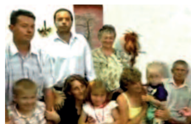
Presentazione alla stampa del Banco Tutori. Si riconosce il Vice Presidente del Premio Giovanni Cinque con le famiglie dei bambini.

In Polonia, la spina bifida è una malattia endemica. Ogni anno, purtroppo, nascono circa 500 bambini polacchi con questa malformazione e le famiglie spesso non dispongono dei mezzi economici per affrontare tale grave problematica. In soccorso di questa emergenza, il Premio Internazionale "Giuseppe Sciacca" e l'Associazione Internazionale di Cultura e Volontariato "Uomo e Società", grazie al generoso sostegno del Centro Ortopedico Emiliano di Reggio Emilia, hanno istituito - in collaborazione con la Città polacca di Kielce - il Banco dei Tutori Ortopedici "Giuseppe Sciacca". Il predetto Banco è attualmente l'unico organismo operante in Polonia per donare gratuitamente tali mezzi di deambulazione. I tutori cambiano radicalmente la vita dei bambini malati, consentendo loro di camminare.