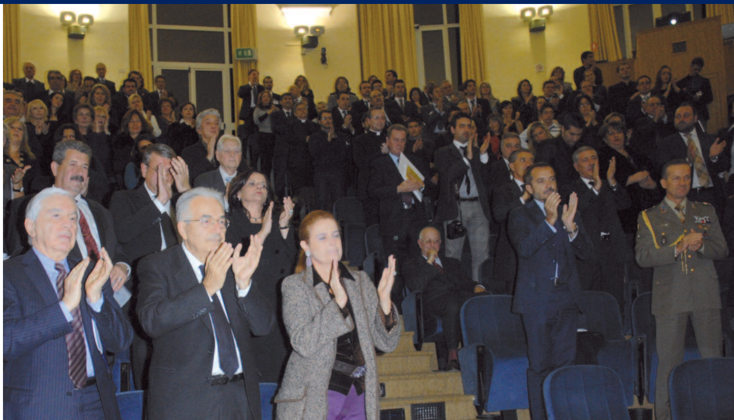
Alcuni momenti della toccante consegna del Premio 'ad memoriam' ai militari caduti