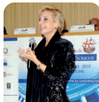
Serenella Pesarin, Direttore Generale del Ministero della Giustizia Dipartimento Giustizia Minorile

Il protocollo d'intesa sottoscritto fra il Ministero della Giustizia - Dipartimento Giustizia Minorile e il Premio Internazionale "Giuseppe Sciacca" (collaborazione iniziata nel 2006), prevede che, in ogni edizione, i minori e i giovani adulti in carico al Dipartimento, possano partecipare all'evento inviando i lavori e/o gli elaborati realizzati nell'ambito della sezione "Cultura della Pace, Tutela dei Minori - Francesco e Giacinta di Fatima". La Giuria si impegna a premiare quei ragazzi i cui elaborati siano stati valutati idonei a dare un contributo significativo per la valorizzazione delle tematiche della pace, dei diritti umani e dei minori in specie, come del rispetto dei più essenziali principi della civile convivenza. I firmatari del protocollo si prefiggono l'importante finalità di diffondere e promuovere una cultura di attenzione a favore degli adolescenti, attribuendo al volontariato un ruolo di rilievo nel reinserimento sociale di coloro che sono entrati nel circuito penale.