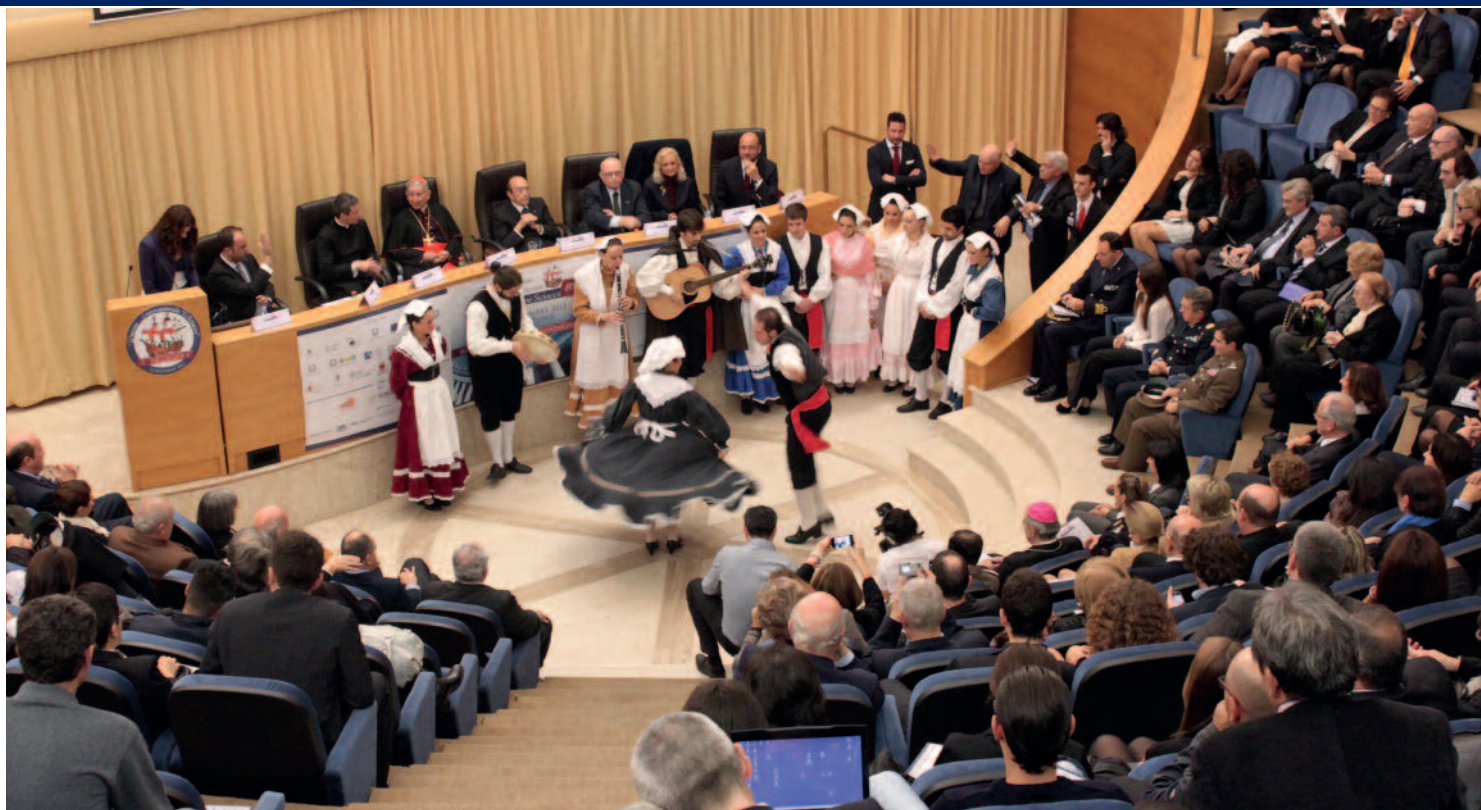
Esibizione del gruppo folkloristico della Fitp