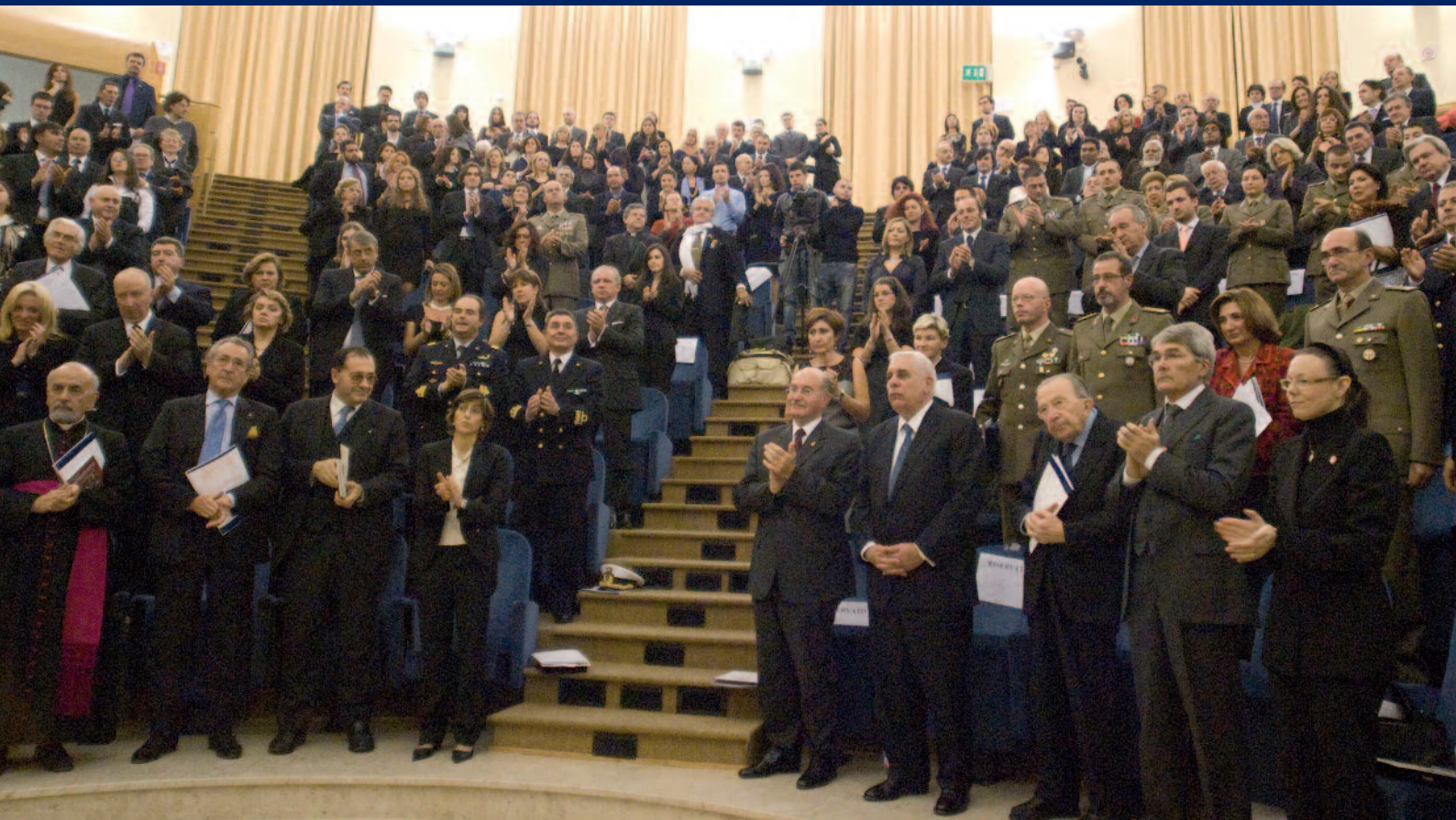
La platea in piedi per il saluto ai militari italiani caduti nelle missioni estere

Al termine della cerimonia gli ospiti hanno partecipato alla cena di Gala, il cui ricavato è stato devoluto in beneficenza.