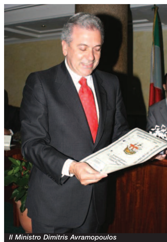
Il Ministro Dimitris Avramopoulos

La delegazione greca, che ha accompagnato il Ministro Avramopoulos , era composta fra gli altri, dall'Ambasciatore di Grecia in Italia S.E. Anastasios Mitsialis e dal Presidente del Comitato Olimpico Greco, Minoas Kyriakou .