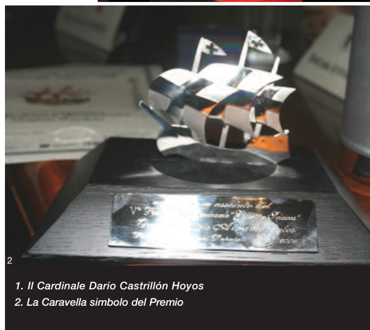
1. Il Cardinale Dario Castrillón Hoyos 2. La Caravella simbolo del Premio