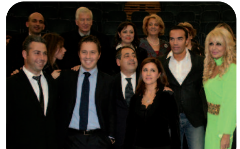
Alcuni rappresentanti della delegazione greca durante l'edizione 2010 del Premio Internazionale G. Sciacca