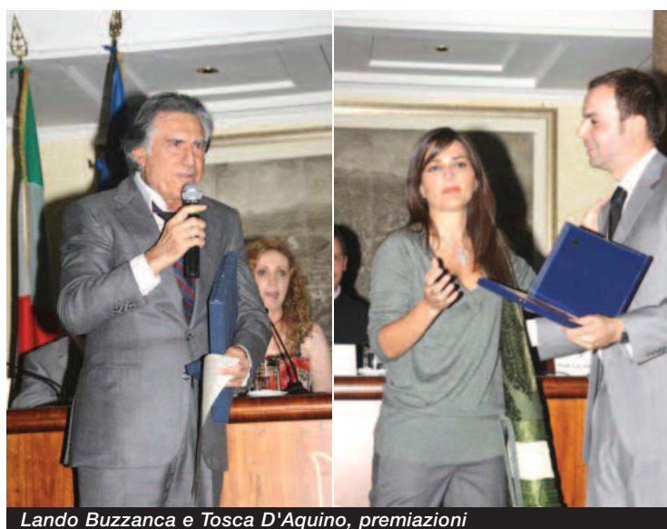
Lando Buzzanca e Tosca D'Aquino, premiazioni