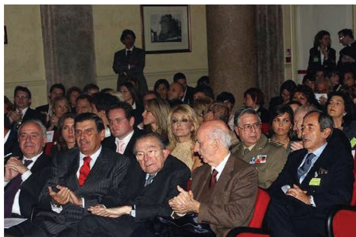
1 a fila: da sinistra Dott. Rosario Priore, Erasmo Cinque, Presidente Giulio Andreotti, Principe Sforza Ruspoli; 2 a fila: Vasiliki Bafatakis, Gen. Donvito, Gen. Venditti; 3 a fila: Tosca D'Aquino.

Presidenza del Consiglio dei Ministri, Ministero degli Affari Esteri, Ministero dell'Istruzione, dell'Università e della Ricerca, Ministero per i Beni e le Attività Culturali, Ministero dell'Ambiente e della Tutela del Territorio, Parlamento Europeo - Ufficio per l'Italia, Comune di Roma, Provincia di Roma, Regione Lazio, Università degli Studi di Roma "La Sapienza", ISGESI, Istituto di Studi Giuridici Economici e Sociali Internazionali.