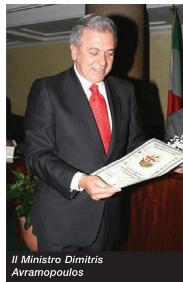
Il Ministro Dimitris Avramopoulos

La delegazione greca, che ha accompagnato il Ministro Avramopoulos , era composta fra gli altri, dall'Ambasciatore di Grecia in Italia S.E. Anastasios Mitsialis e dal Presidente del Comitato Olimpico Greco, Minoas Kyriakou .