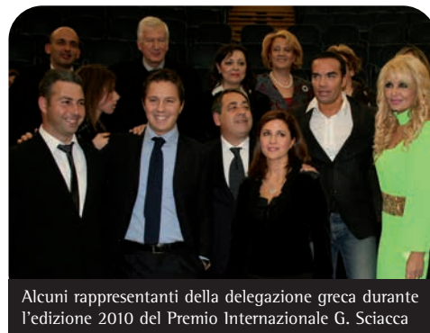
Alcuni rappresentanti della delegazione greca durante l'edizione 2010 del Premio Internazionale G. Sciacca

A seguito di una lunga collaborazione, il Premio Internazionale "Giuseppe Sciacca" ha firmato nel 2010 un protocollo d'intesa con la Repubblica Ellenica- Prefettura di Lesvos, ora confluita nella Regione dell'Egeo Settentrionale. Il protocollo prevede, tra l'altro, importanti forme di cooperazione di tipo socio - culturale, con particolare attenzione al volontariato giovanile, favorendo rapporti di fattiva amicizia fra ragazzi greci e italiani, nell'ambito del più ampio contesto europeo.