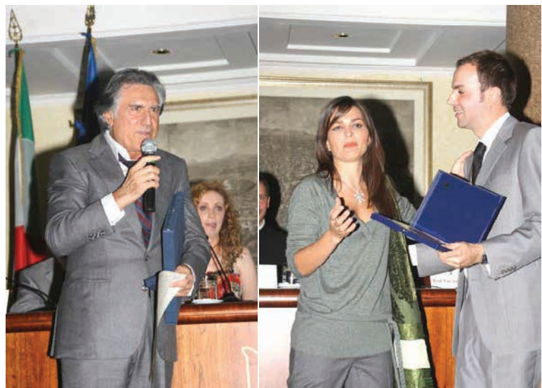
Lando Buzzanca e Tosca D'Aquino, premiazioni