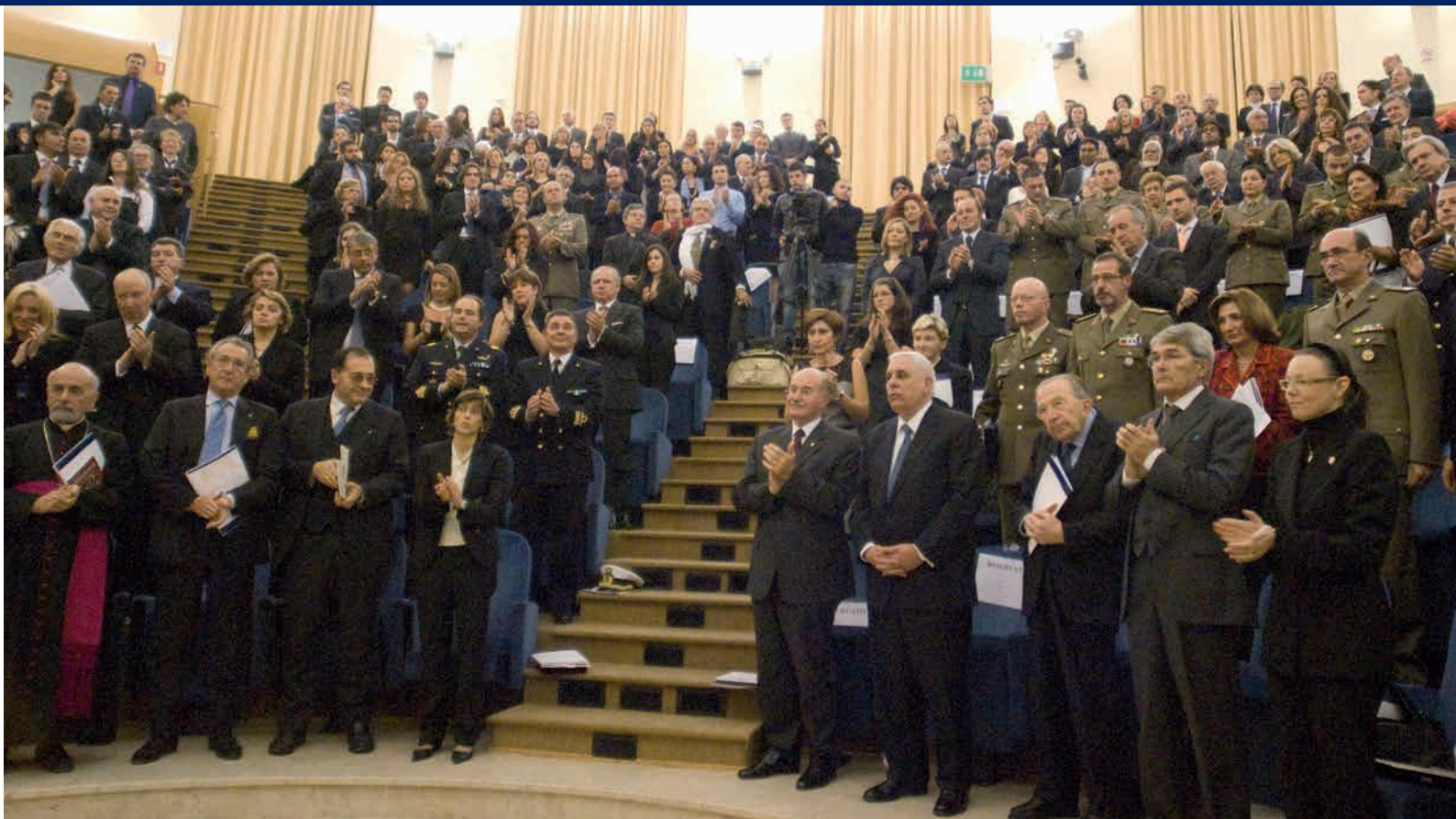
La platea in piedi per il saluto ai militari italiani caduti nelle missioni estere